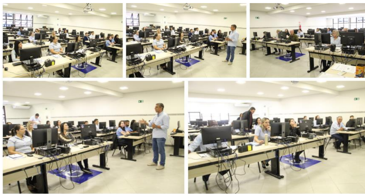
Curso de Treinamento “Conhecimentos Básicos de Informática...”

Comissão Própria de Avaliação – CPA/FAME/FUNJOBE