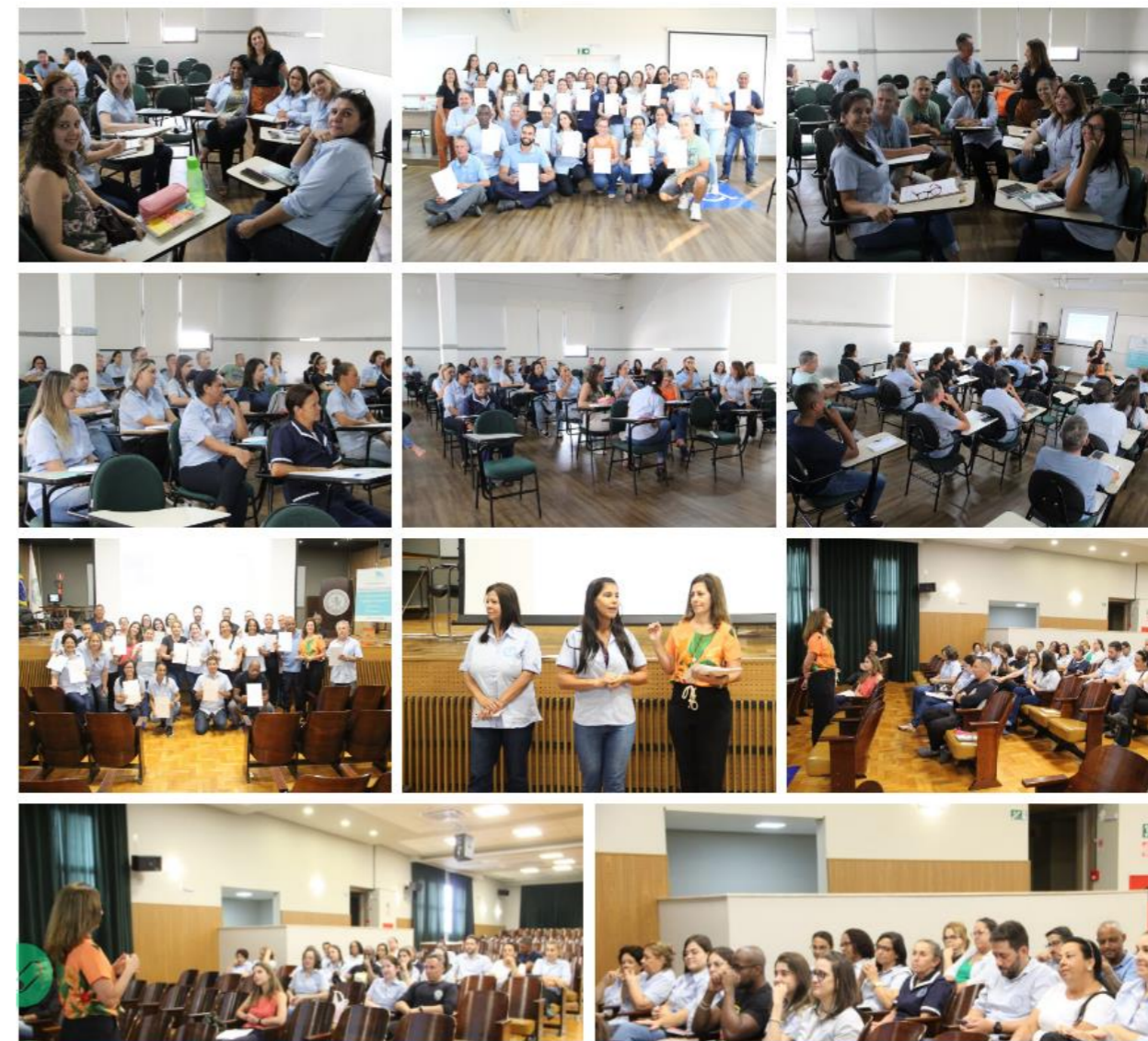
Curso sobre Atendimento ao Público para profissionais da Faculdade – 30 e 31 de Março/2023.