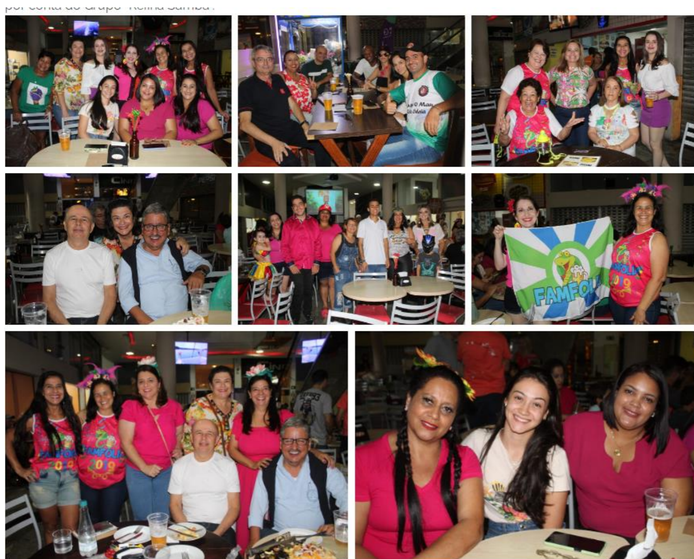
2ª edição do Pré-Carnaval FAMFolia – Fevereiro/2023