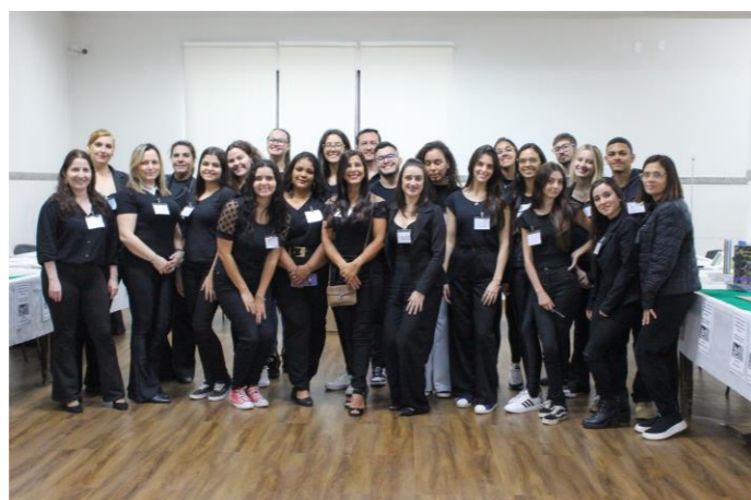
Acadêmicos da Equipe de Apoio do Encontro de Escritores - 2023

- Acadêmicos no “II Encontro de Escritores de Barbacena e Região” (Agosto/2023) e “Apresentação na Sexta Cultural Musical (Acadêmicas e Professor como protagonistas) (Dezembro/2023)”