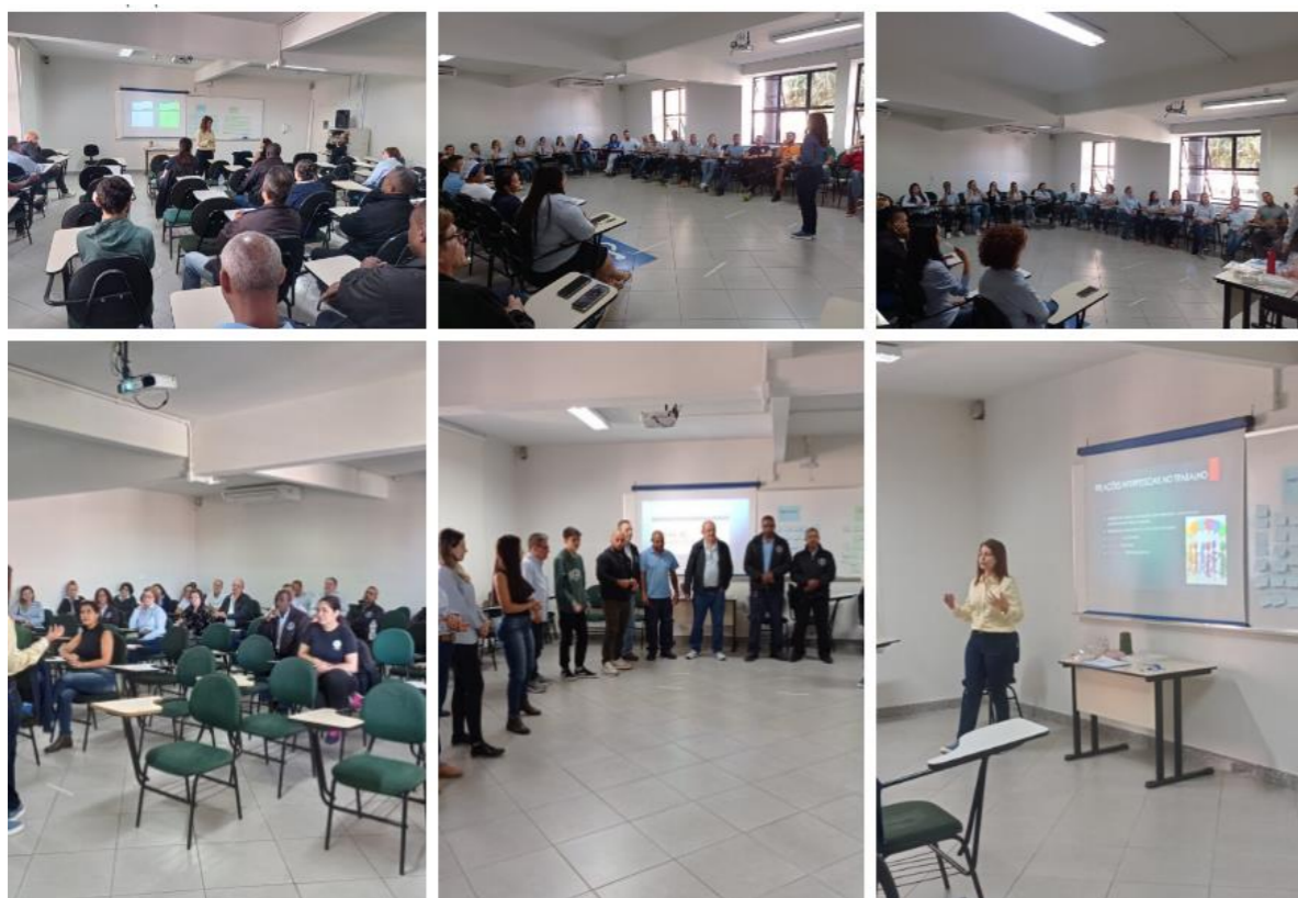
Curso com o tema “Relações Interpessoais no Trabalho”