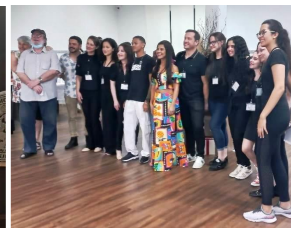
Acadêmicos Equipe de Apoio do Evento